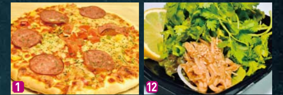
PIZZA(カルパス&トマト) 大人気!! パクチー&バンバンジー