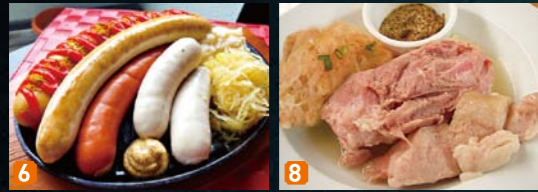
バイエルン・クラシックプレート アイスバイン