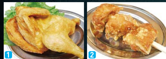
若鶏半身揚げ ざんぎ棒