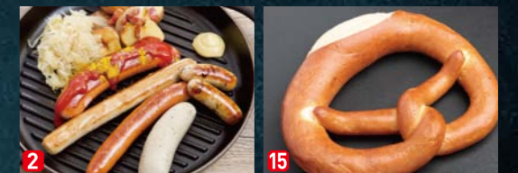
ソーセージプレート・5種盛り 発酵バター入りバタープレッツェル